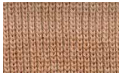
[ROOIBOS / HALF]