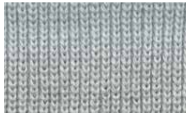
[RED TURNIP / HALF]