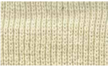
[MATCHA / QUARTER]