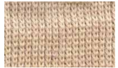
[TURMERIC / QUARTER]