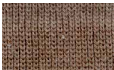
[COFFEE BEANS / HALF]