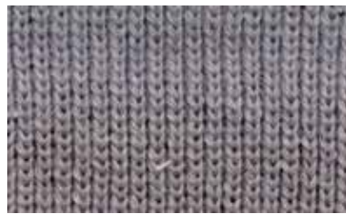
[BLUEBERRY / HALF]