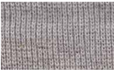
[BLUEBERRY / QUARTER]