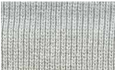
[RED TURNIP / QUARTER]