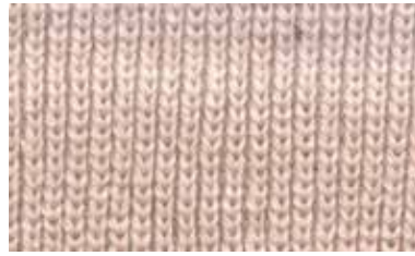
[SAKURA / HALF]