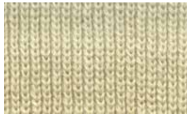
[MATCHA / HALF]