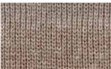
[COFFEE BEANS / QUARTER]