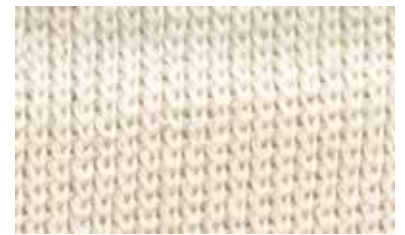
[GINGER / QUARTER]