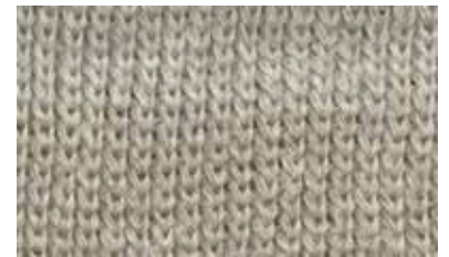
[SWERTIA JAPONICA / QUARTER]